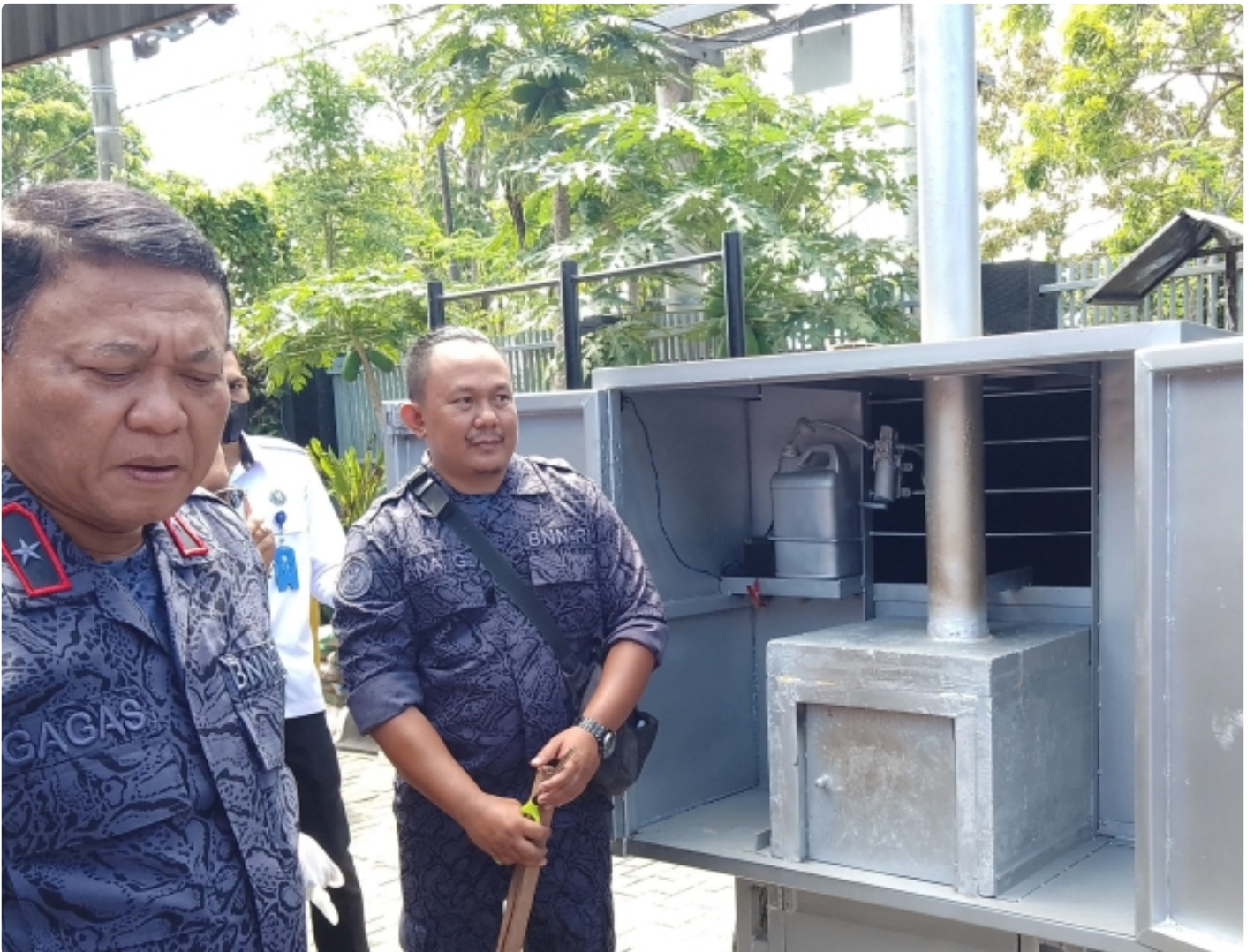
Kepala BNNP NTB saat pemusnahan BB sabu dengan mesin insenerator. (10/11)

Mataram NTB - Menindak lanjuti peraturan perundang-undangan terkait pemusnahan barang bukti narkotika yang disita dari hasil penindakan atas Peredaran gelap Narkotika, Badan Narkotika Nasional Provinsi Nusa Tenggara Barat (BNNP NTB) melakukan pemusnahan Barang Bukti hasil pengungkapan