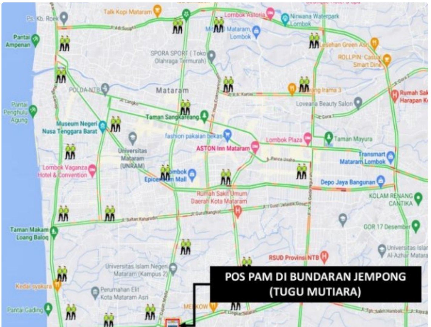
Personel yang Disiagakan pada Pos Pengamanan dan Pos Penyekatan, (04/11)

Mataram NTB - Mendukung terselenggaranya event Internasional Word Superbike (WSBK) Mandalika 2022 berlangsung sukses, ribuan personel akan disiagakan di dalam wilayah pulau Lombok, untuk itu para penonton tidak perlu