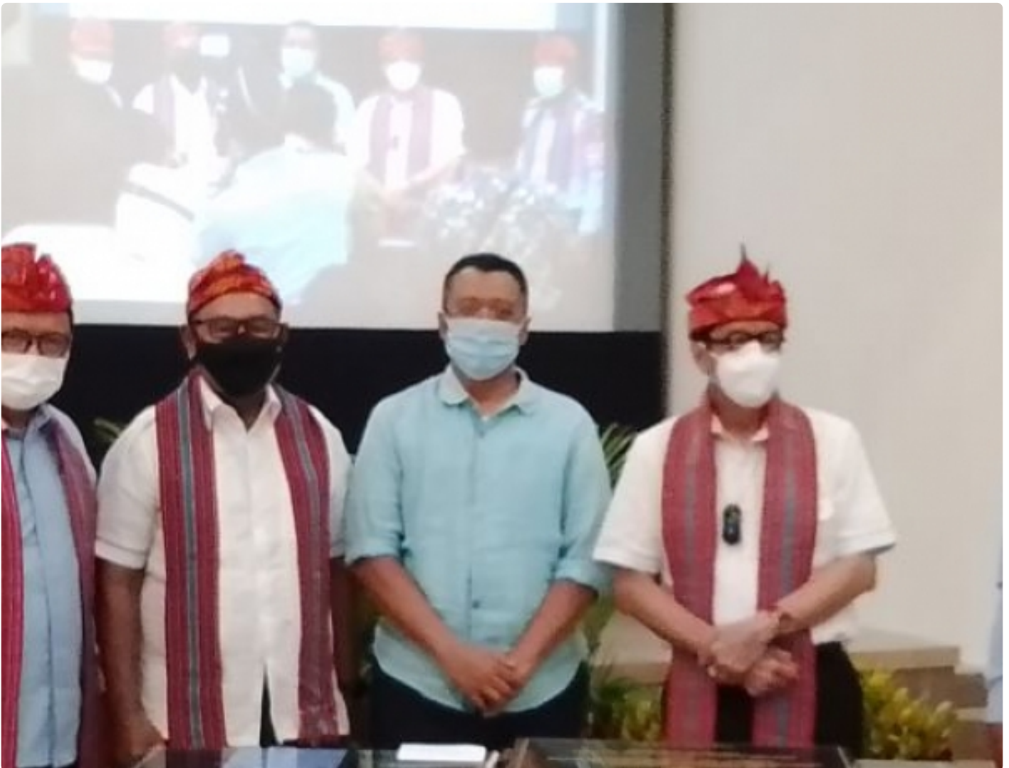
Yasonna Laoly dan Gubernur NTB saat mengikuti kegiatan kegiatan di Kumham NTB, (21/03)

Mataram NTB - Menteri Hukum dan Ham RI Yasonna H. Laoly menghadiri acara Pengukuhan Desa / Kelurahan Sadar Hukum dan Penandatanganan Berita