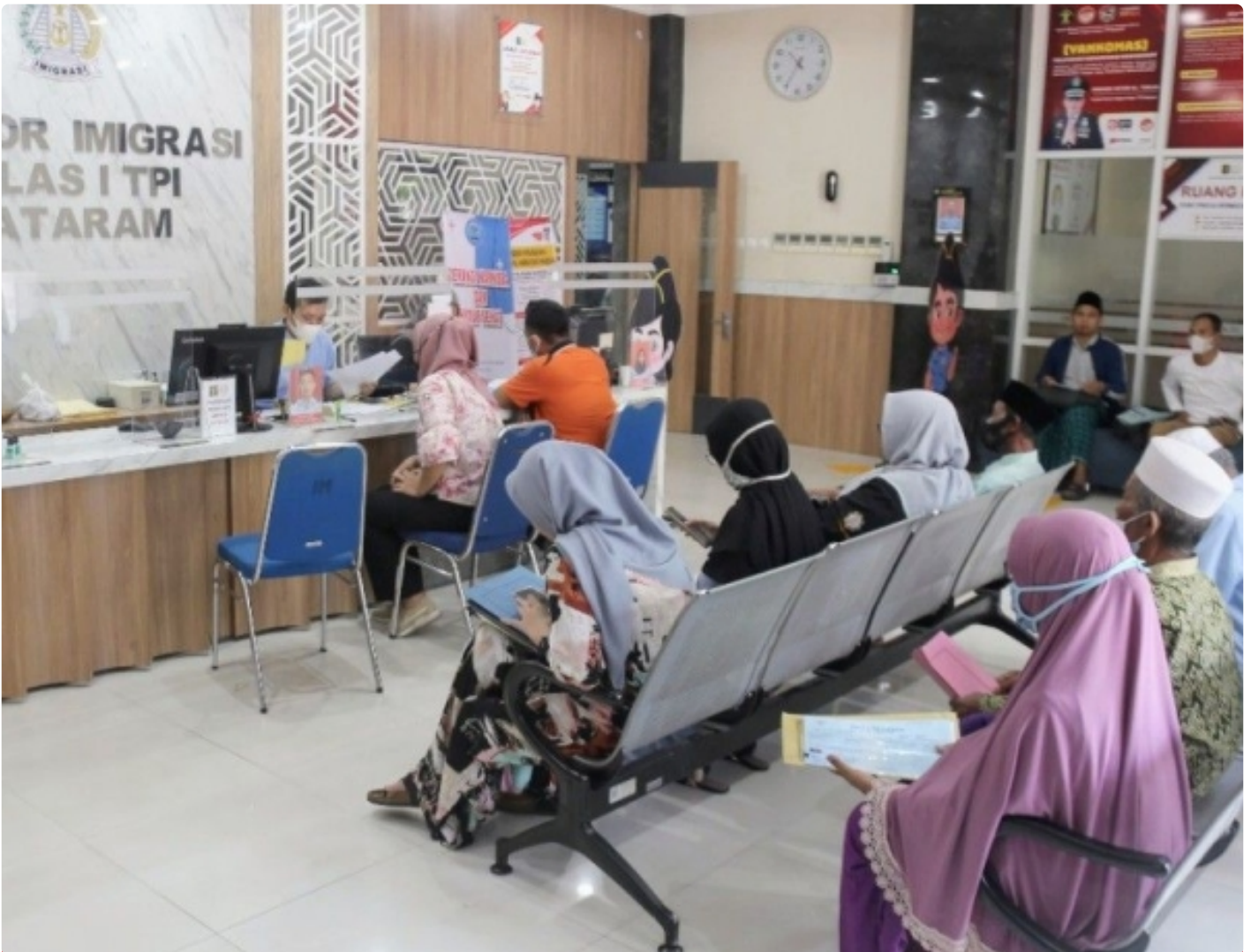
Layanan Paspor Imigrasi Mataram di Akhir Pekan, (15/01/2023)

Mataram NTB – Kantor Imigrasi Kelas I TPI Mataram Kanwil Kemenkumham NTB kembali menggelar layanan paspor simpatik yang diselenggarakan pada Sabtu dan Minggu 14 – 15 Januari 2023. Layanan ini diberikan sesuai instruksi Direktorat Jenderal Imigrasi melalui surat nomor IMI.7-UM.01.01-092, dan dilaksanakan dalam rangka memperingati Hari Bhakti Imigrasi (HBI) yang akan